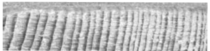
Timret på gammelstugan i Pålås, Galåsen har blivit daterat till 1833. Bilden av det ovanligt tydliga träprovet visar 70 av de 140 årsringarna.