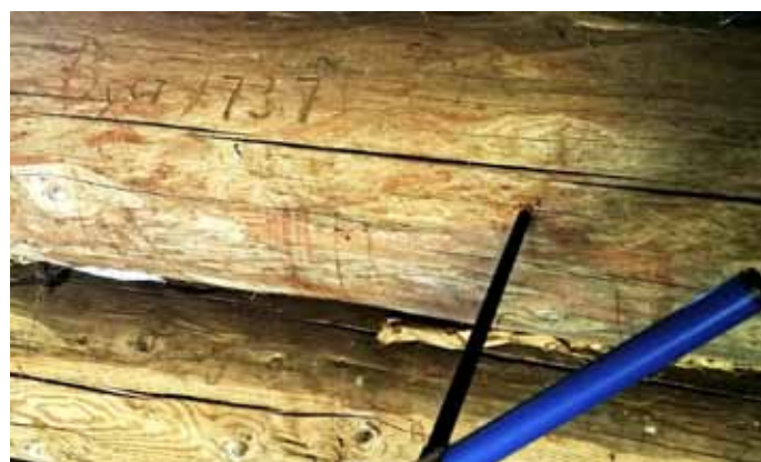
Inskriptionen på låven, "DerSø" i Storsvea är inte ursprunglig. Granstocken visade sig vara nästan 60 år yngre och avverkad vintern 1794/95.

På Bakken var den stora låven överraskande enhetlig byggd. Alla undersökta stockar var av gran och avverkade mellan 1793 och 1795. Det måste ha