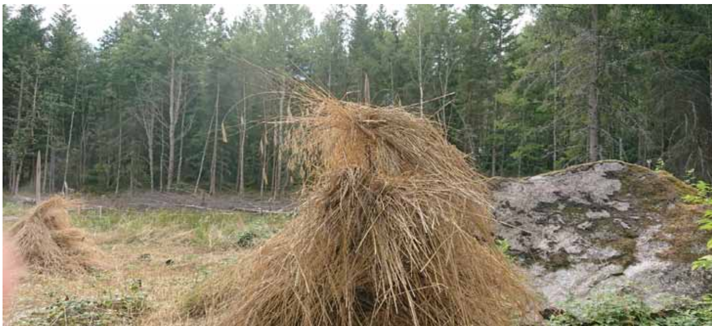
Svedjerågen står kvar på sina krakar på svedjan vid Linnés Hammarby i augusti 2020.

Fredagen 3 mars samlas vi på Fagerudd Konferens, vilket ligger 5 kilometer söder om Enköping. År 1911 öppnade konditorn i Enköping, K H Lundevall sommarpensionatet Fagerudd. I mitten av 1980-talet blev det en konferensanläggning. Anläggningen ligger vackert långt in i en vik av Mälaren. Det är första gången som FINNSAM träffas utanför Enköping, Sveriges närmaste stad. Inom en tolv mils radie finns hela trettioåttio städer.