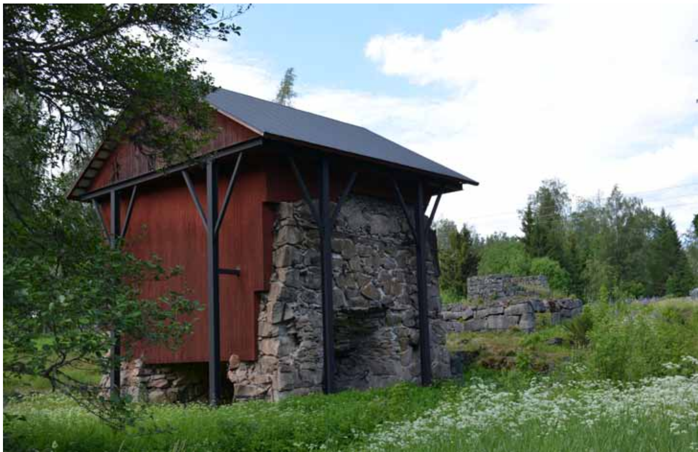
Bosjöhyttan, en av finnehyttorna i Filipstads bergslag.