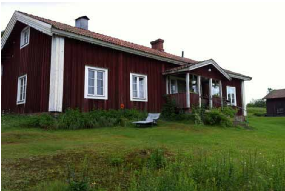
Parstugan i Mattila som den såg ut innan den förstördes av branden den 17 oktober 2020

Det är som alla förstår väldigt svårt att planera några aktiviteter inför år 2021. Men skulle det trots allt vara möjligt att hålla en konferens under hösten så har styrelsen i Solør-Värmland finnkulturförening tänkt föreslå FINNSAMS styrelse detta upplägg: