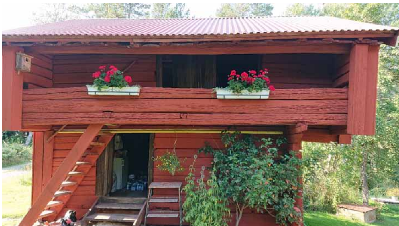
På gården Arvidstorp i Skedevi socken finns en gammal loftbod kvar.